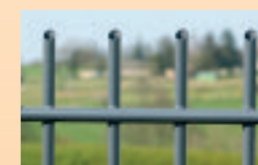
Standard típus: 45°-ban ferdén levágott rudak