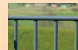
Vezetőrúddal való lezárás