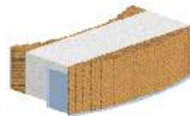
Alaprajzilag íves TRAV.