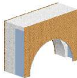
TRAV íves nyílászáróhoz.