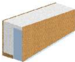
TRAV ferde nyílászáróhoz.